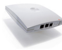
Kirk Wireless Server 600v3

De KIRK Wireless Server 600v3 biedt als Single-Cell oplossing ruimte voor het aanmelden van 35 draadloze gebruikers. Het systeem kan uitgebreid worden naar een multicell oplossing waardoor tot 1500 gebruikers door middel van maximaal 256 Wireless Servers over een groot gebied draadloos bereikbaar zijn. Daarnaast kan het dekkingsgebied verder worden vergroot door middel van repeaters.