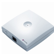
Kirk Wireless Server 300

De KIRK Wireless Server 300 is een single cell oplossing voor KMO's waarvan 12 mensen moeten bereikbaar zijn. Er kunnen 4 gebruikers simultaan bellen. U kunt de reikwijdte vergroten door meerdere repeaters in elkaars bereik te plaatsen. Zodoende kunt u ook grote gebieden voorzien van draadloze telefonie.